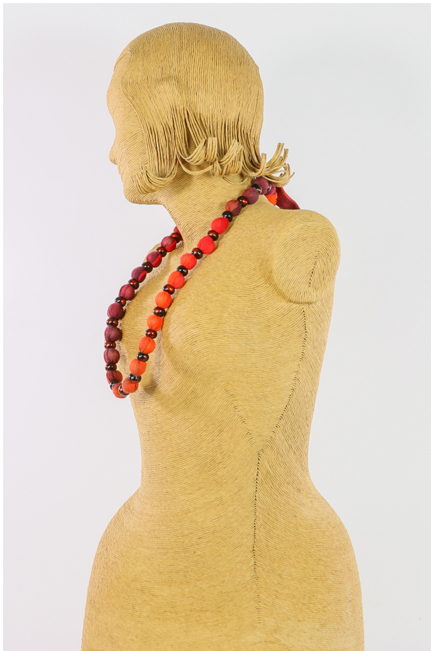
Collana lana bio