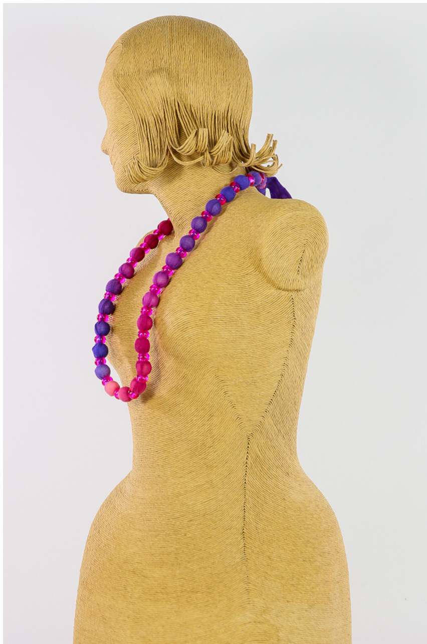
Collana lana bio