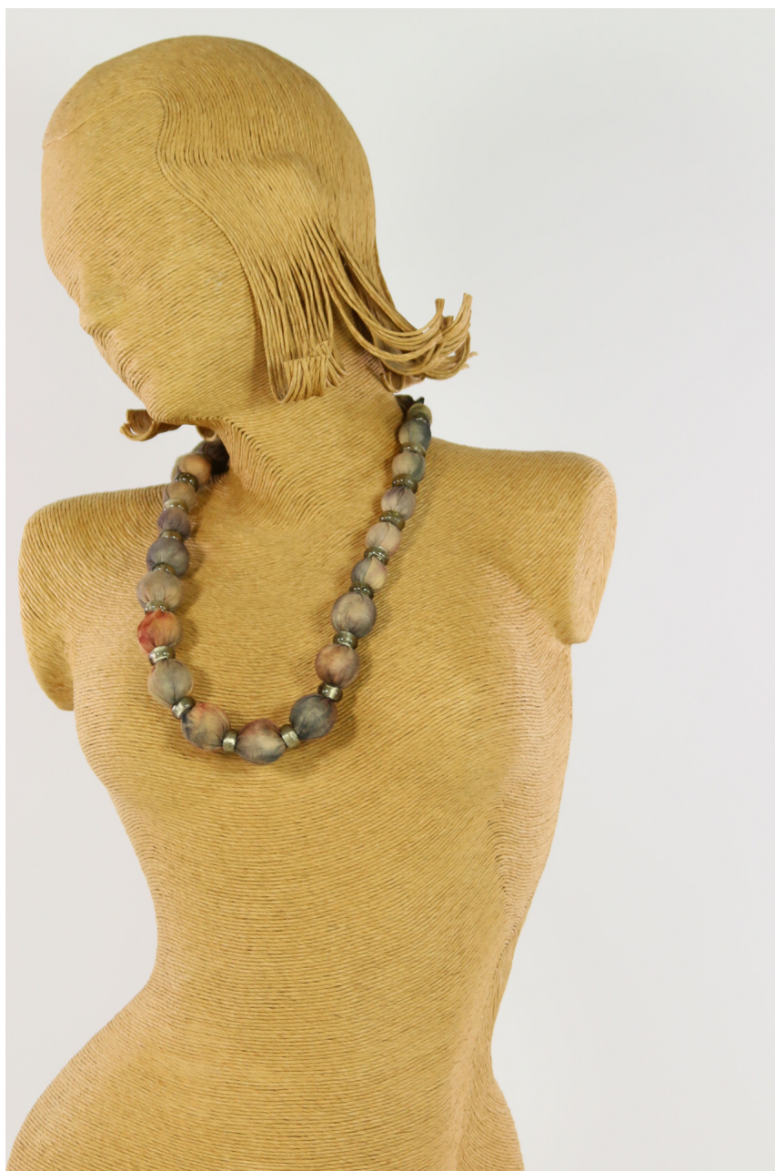
Collana lana bio