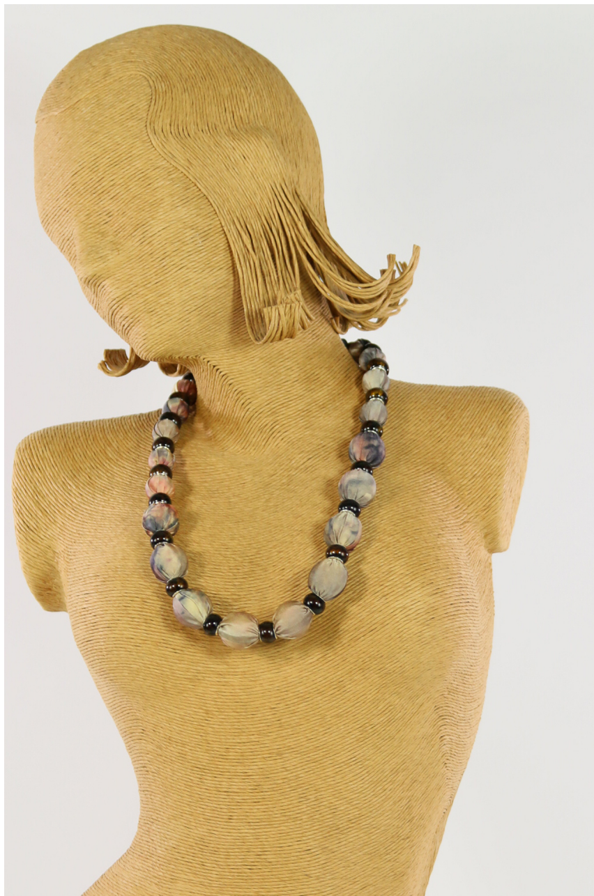
Collana seta della pace